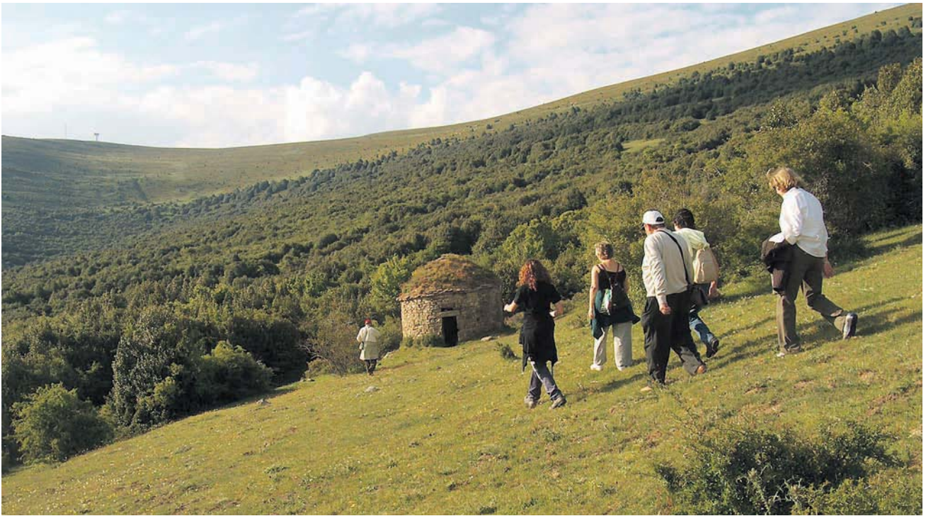
Ruta a través del acebal